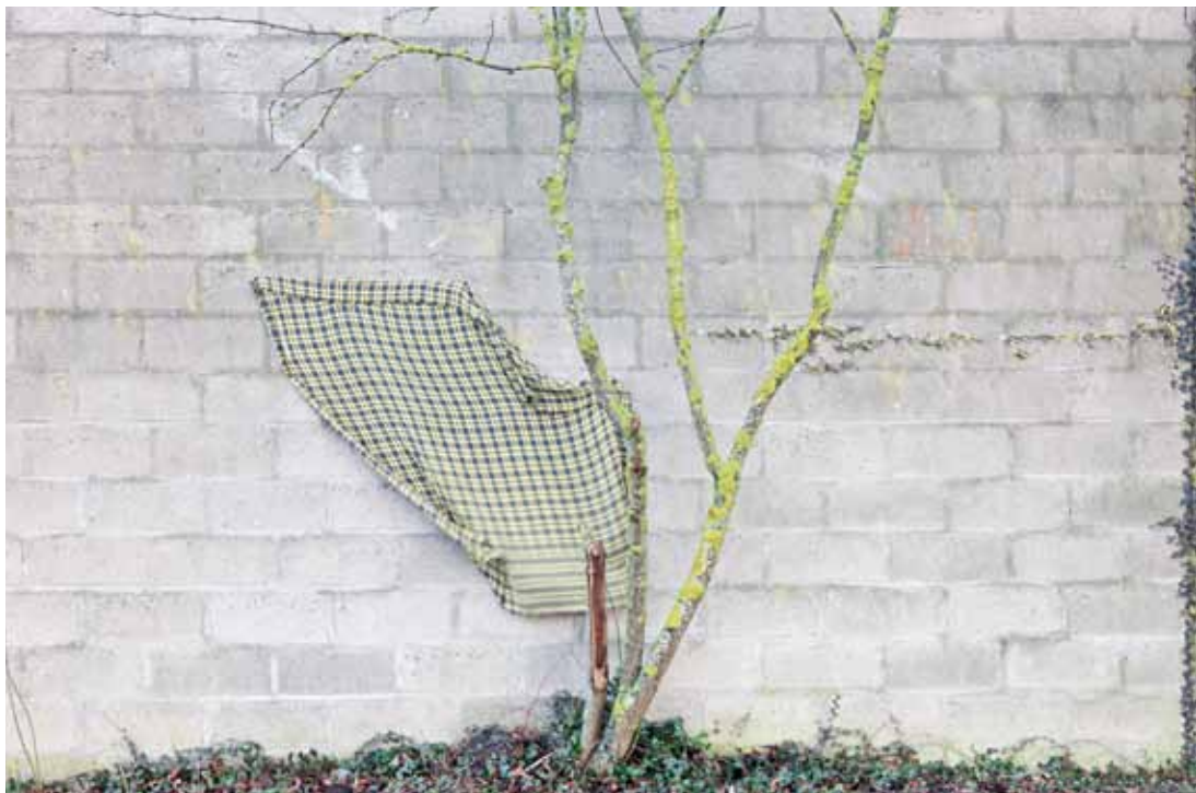
3 / Uden titel / Carola Björk*