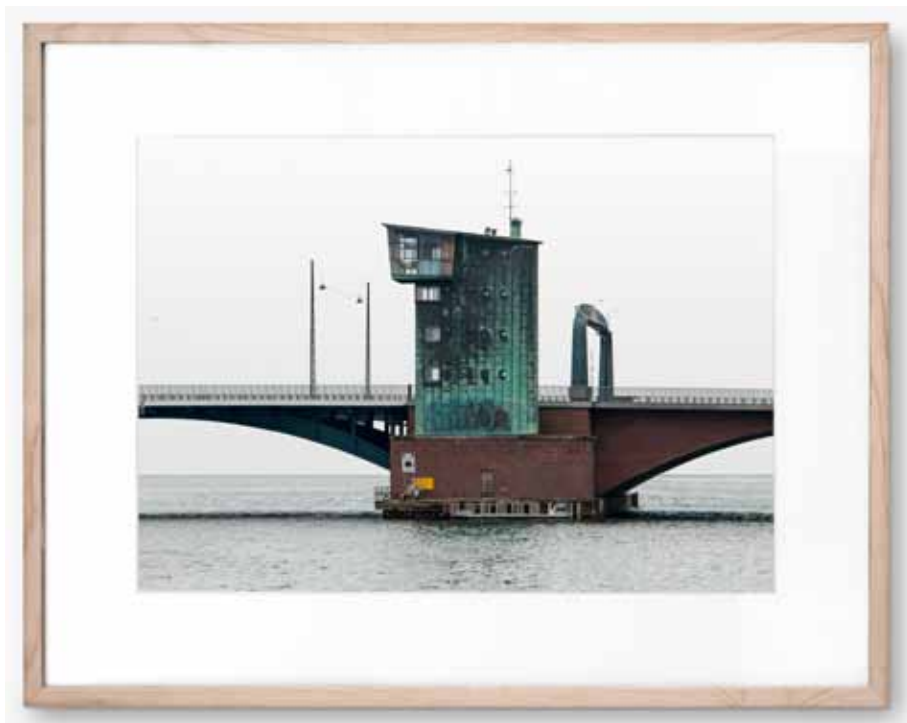
24 / Manøvrehus_2