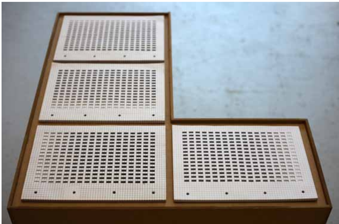
1 / Hældning / Tine Adler*